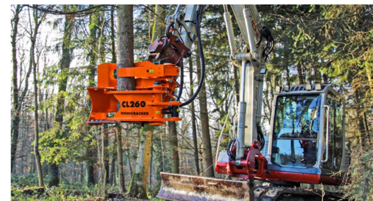
Optional auch mit Sammelgreifer.