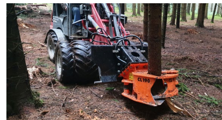
Woodcracker® CL schneidet weiches Holz bis zu 40cm.