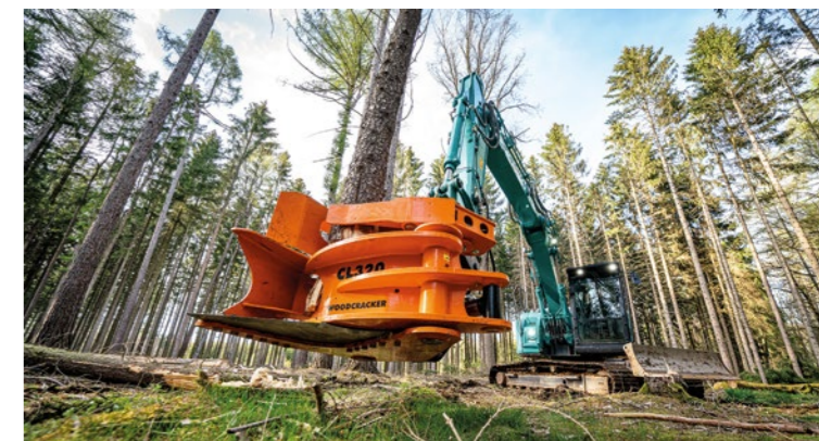
Schnelle Ernte von kleinen Bäumen.