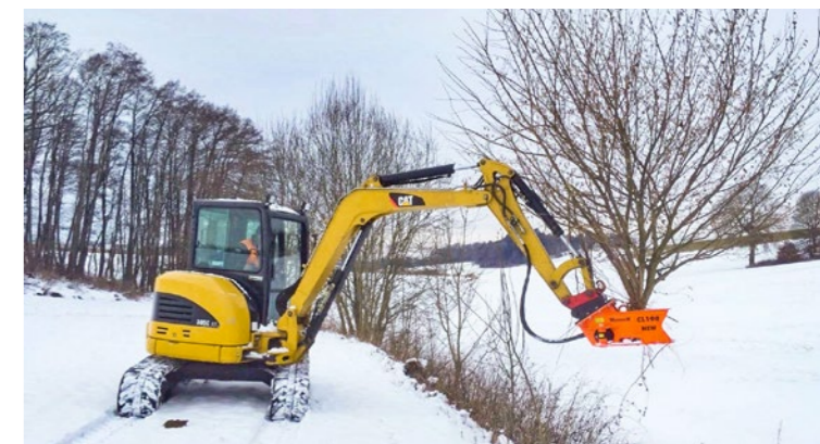
Für Minibagger ab 2,5t.